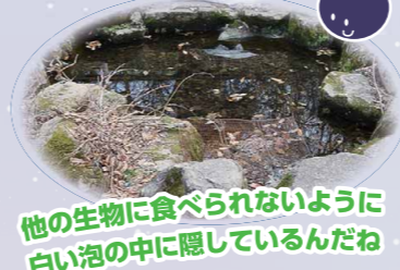
他の生物に食べられないように白い泡の中に隠しているんだね