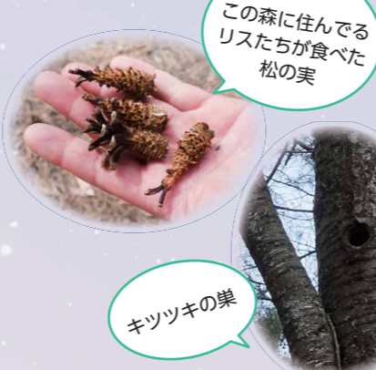
この森に住んでるリスたちが食べた松の実

卵のある場所は必ず水面の上で、産卵からおおよそ2週間でオタマジャクシが姿を現します。