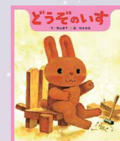
絵本「どうぞのいす」 作: 香山美子 絵: 柿本幸造

錯覚って見ているものじゃなくて心の中で感じるこなんだからわかってきたかな。しょうこせいと「どうぞのいす」の動物たちが感じたことを想像してみよう。